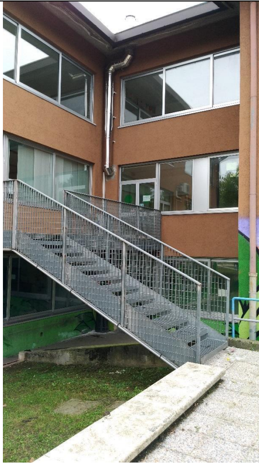
INGRESSO BIBLIOTECA DAL PARCO